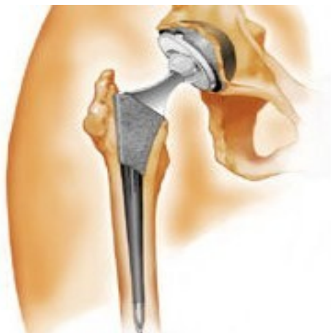
ендопротезиране на тазобедрена става

Екипът ортопеди на Клиника по ортопедия и травматология на УМБАЛ „Царица Йоанна – ИСУЛ“ винаги подхожда индивидуално към проблемите на пациентите с коксартроза. След изчерпване на възможностите за медикаментозно лечение разглеждаме възможностите и препоръчваме органосъхраняващо оперативно лечение. В крайните стадии на заболяването, когато възможностите на другите методи за лечение са изчерпани, съвременното лечение на коксартрозата е ендопротезирането на тазобедрената става.